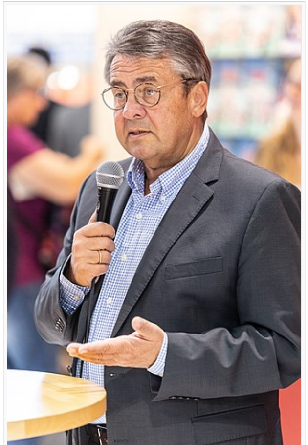
Sigmar Gabriel (2018)

Durch seine lange Tätigkeit in politischen Funktionen hat der Minister a.D. ein breites Netzwerk an Kontakten. Dieses ist für Akteure aus der Privatwirtschaft attraktiv um ihren Belangen Gehör in Regierungskreisen verschaffen. Für sein Auftreten nach Amtsausstieg geriet Gabriel wiederholt in die Kritik: Für Beratertätigkeiten, wie etwa für die Tönnies Holding, welche in der Corona-Pandemie wegen schlechter Arbeitsbedingungen in ihren Schweinemastbetrieben kritisiert wurde [2] ; wegen seines nach Karriereende kurzfristigen Seitenwechsels zur Deutschen Bank [3] ; oder aufgrund seiner Auftritte bei intransparenten Abendessen gemeinsam mit Mandatsträger:innen und Vertreter:innen der Rüstungs- und Automobilindustrie. [4]