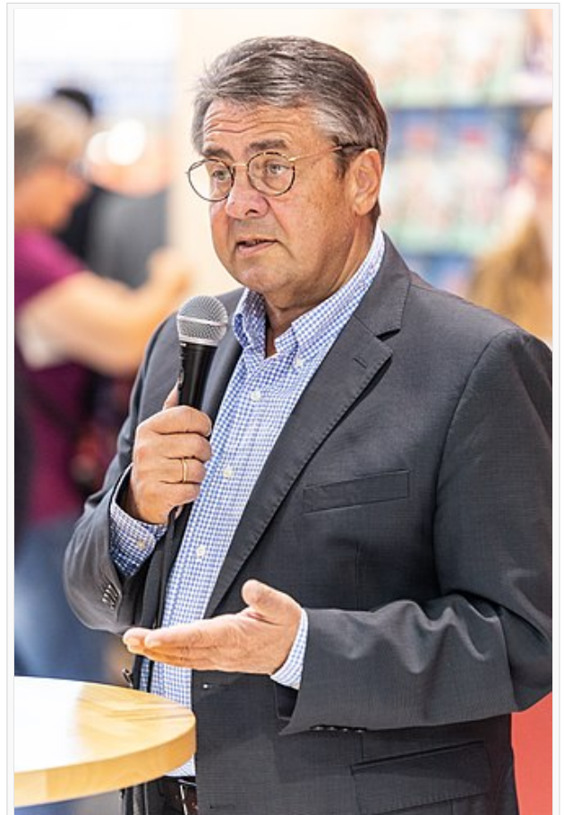
Sigmar Gabriel (2018)