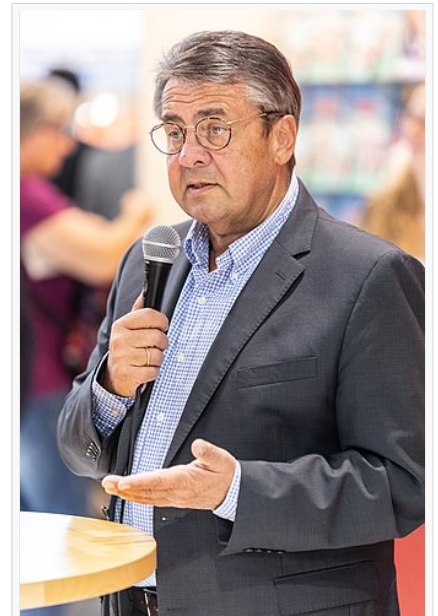
Sigmar Gabriel (2018)