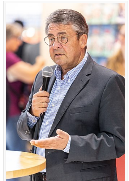
Sigmar Gabriel (2018)

Gabriels zahlreiche Seitenwechsel zeigen die Notwendigkeit einer starken Karenzzeitregelung . [6]