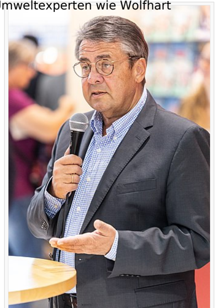
Sigmar Gabriel (2018)

Durch seine lange Tätigkeit in politischen Funktionen hat der Minister a. D. ein breites Netzwerk an Kontakten. Dieses ist für Akteure aus der Privatwirtschaft attraktiv um ihren Belangen Gehör in Regierungskreisen verschaffen. Für sein Auftreten nach Amtsausstieg geriet Gabriel wiederholt in die Kritik: Für Beratertätigkeiten, wie etwa für die Tönnies Holding [2] ; wegen seines nach Karriereende kurzfristigen Seitenwechsels zur Deutschen Bank [3] ; oder aufgrund seiner Auftritte bei intransparenten Abendessen gemeinsam mit Mandats-träger:innen und Vertreter:innen der Rüstungs- und Automobilindustrie. [4] Im Mai 2025 soll Gabriel in den Aufsichtsrat des Rüstungskonzerns Rheinmetall gewählt werden. [5]