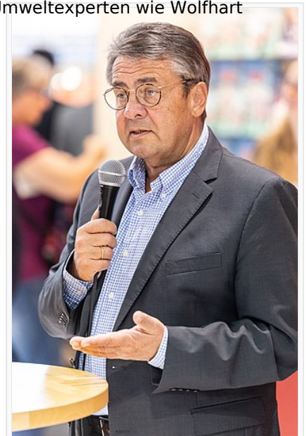
Sigmar Gabriel (2018)

Durch seine lange Tätigkeit in politischen Funktionen hat der Minister a. D. ein breites Netzwerk an Kontakten. Dieses ist für Akteure aus der Privatwirtschaft attraktiv um ihren Belangen Gehör in Regierungskreisen verschaffen. Für sein Auftreten nach Amtsausstieg geriet Gabriel wiederholt in die Kritik: Für Beratertätigkeiten, wie etwa für die Tönnies Holding [2] ; wegen seines nach Karriereende kurzfristigen Seitenwechsels zur Deutschen Bank [3] ; oder aufgrund seiner Auftritte bei intransparenten Abendessen gemeinsam mit Mandats-träger:innen und Vertreter:innen der Rüstungs- und Automobilindustrie. [4] Im Mai 2025 soll Gabriel in den Aufsichtsrat des Rüstungskonzerns Rheinmetall gewählt werden. [5]