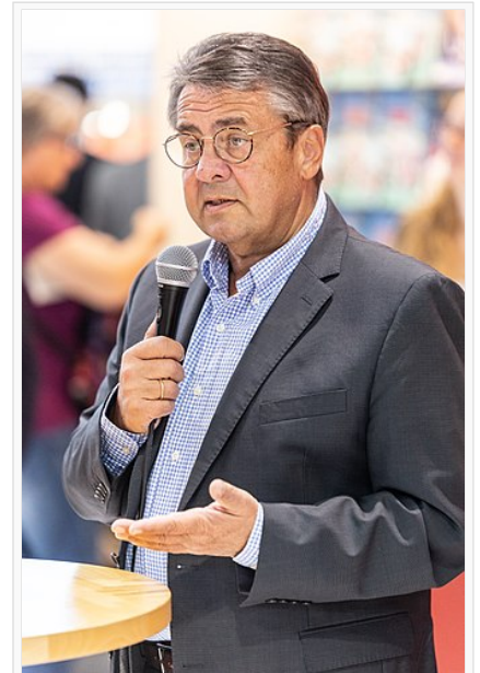
Sigmar Gabriel (2018)