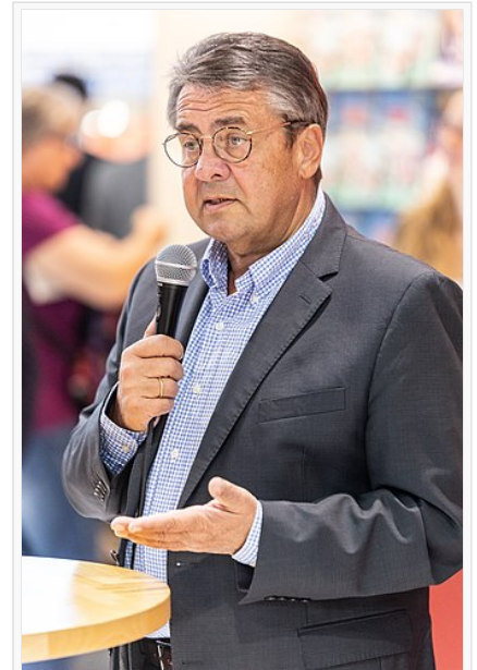
Sigmar Gabriel (2018)

Durch seine lange Tätigkeit in politischen Funktionen hat der Minister a. D. ein breites Netzwerk an Kontakten. Dieses ist für Akteure aus der Privatwirtschaft attraktiv um ihren Belangen Gehör in Regierungskreisen verschaffen. Für sein Auftreten nach Amtsausstieg geriet Gabriel wiederholt in die Kritik: Für Beratertätigkeiten, wie etwa für die Tönnies Holding [2] ; wegen seines nach Karriereende kurzfristigen Seitenwechsels zur Deutschen Bank [3] ; oder aufgrund seiner Auftritte bei intransparenten Abendessen gemeinsam mit Mandats- träger:innen und Vertreter:innen der Rüstungs- und Automobilindustrie. [4] Im Mai 2025 soll Gabriel in den Aufsichtsrat des Rüstungskonzerns Rheinmetall gewählt werden. [5]