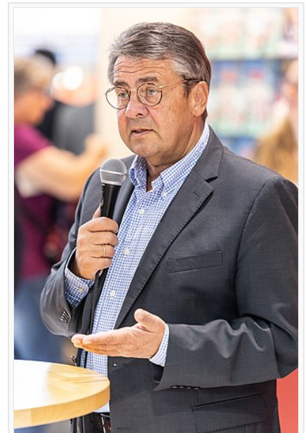
Sigmar Gabriel (2018)