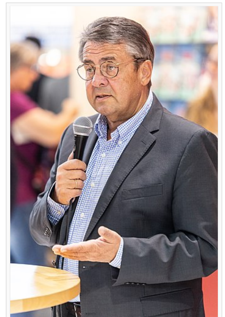
Sigmar Gabriel (2018)